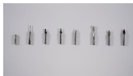
Frezy i wkładki