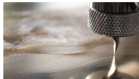
Materiały do grawerowania mechanicznego