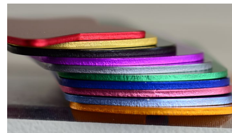
Produkty gotowe do grawerowania