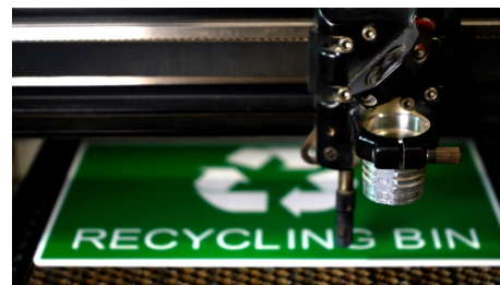
Materiały do grawerowania laserowego

Nasz asortyment materiałów został specjalnie opracowany do grawerowania i cięcia. Grawerowanie „od frontu” lub „od spodu”, znakowanie laserowe lub grawerowanie za pomocą frezu, również kompatybilne z drukiem UV. Wszystkie nasze gamy laminatów grawerskich, metali i akryli są dostępne w szerokiej gamie kolorów, grubości i z różnym efektem wykończenia.